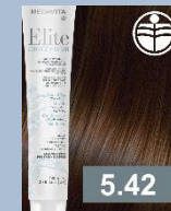
SVĚTLÁ HNĚDÁ MĚDĚNÁ FIALOVÁ