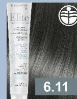
TMAVÁ BLOND POPELAVÁ HLUBOKÁ