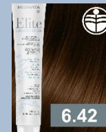
TMAVÁ BLOND MĚDĚNÁ FIALOVÁ