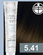
SVĚTLÁ HNĚDÁ MĚDĚNÁ POPELAVÁ