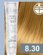
SVĚTLÁ BLOND ZLATÁ INTENZIVNÍ