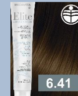
TMAVÁ BLOND MĚDĚNÁ POPELAVÁ