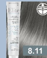
SVĚTLÁ BLOND POPELAVÁ HLUBOKÁ