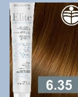
TMAVÁ BLOND ZLATÁ MAHAGONOVÁ