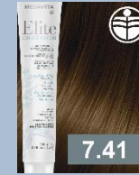
BLOND MĚDĚNÁ POPELAVÁ