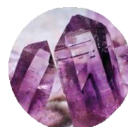
FIALOVÉ / IRISÉ