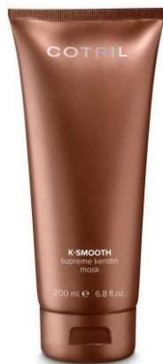
200 ml Kód: 6450