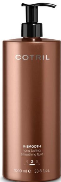
1000 ml Kód: 6435