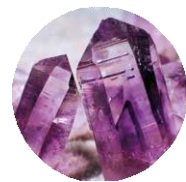
FIALOVÉ / IRISÉ