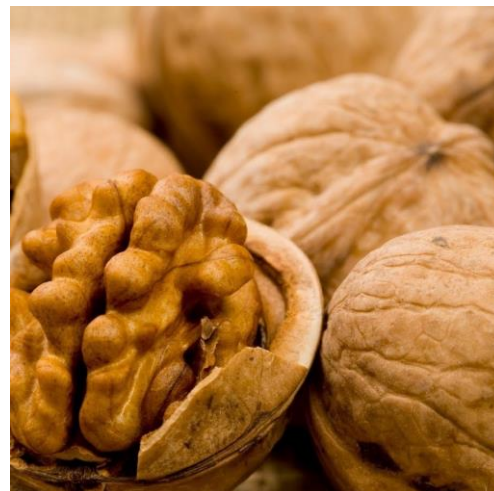
BĚŽOVÁ Extrakt z vlašských ořechů s posilujícími a rozjasňujícími účinky