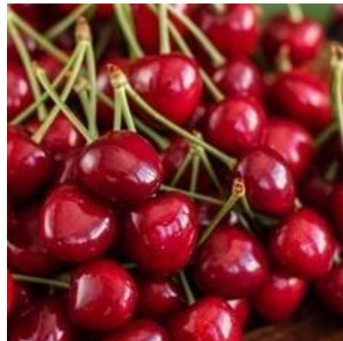
ČERVENÁ Třešňový extrakt se zjemňujícím a antioxidačním působením