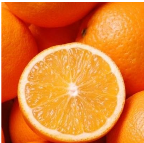
MĚDĚNÁ Pomerančový extrakt s pečujícím účinkem pro kondici vlasů