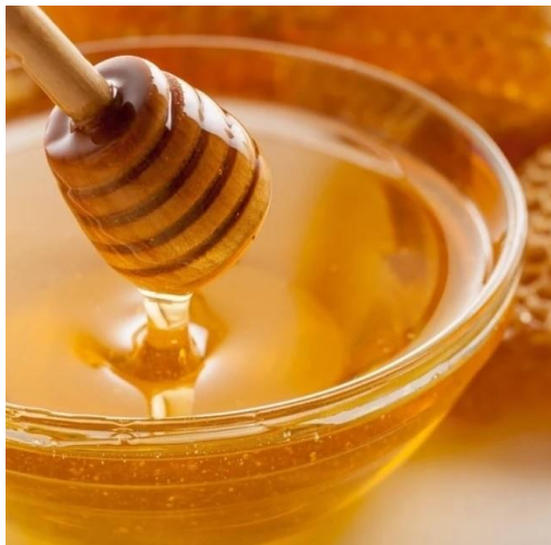
ZLATÁ Medový extrakt pro hebké a hedvábné délky vlasů