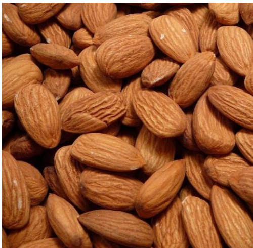
HNĚDÁ Mandlový extrakt s hydratačním a zklidňujícím účinkem