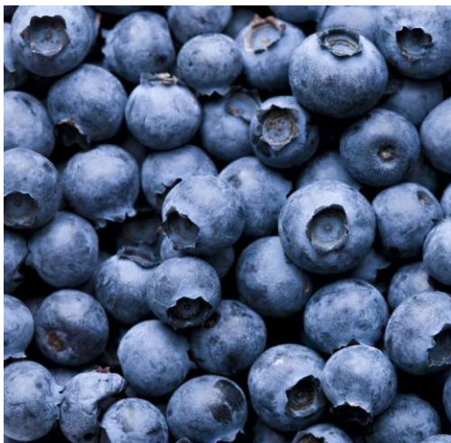
FIALOVÁ Borůvkový extrakt s rozjasňujícím a antioxidačním účinkem