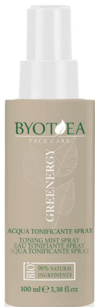
TONIZAČNÍ VODA VE SPREJI 100 ml