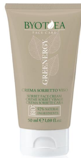
KRÉM SORBET 50 ml