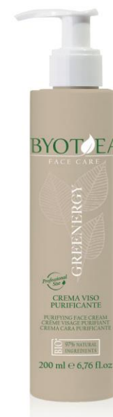
ČISTÍCÍ KRÉM PROFESIONAL 200 ml