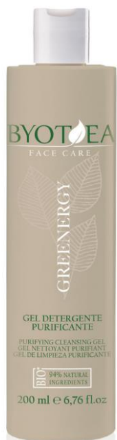
ČISTÍCÍ GEL 200 ml