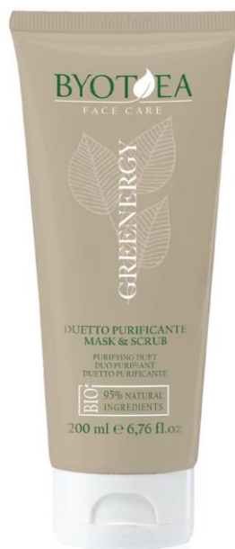
ČISTÍCÍ DUO MASKA & SCRUB 200 ml